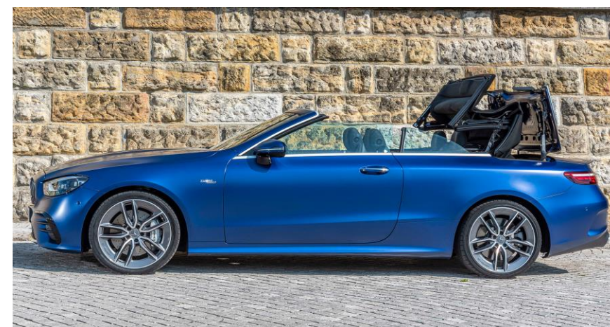
Diseño con reducción al mínimo de líneas y aristas. El resultado es un diseño purista que irradia discreción y deportividad.