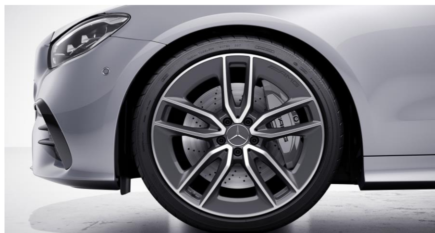
Llantas de aleación AMG de 20" y 5 radios color gris tántalo y pulidas a alto brillo, delante: 245/35 R20 ,detrás: 275/30 R20