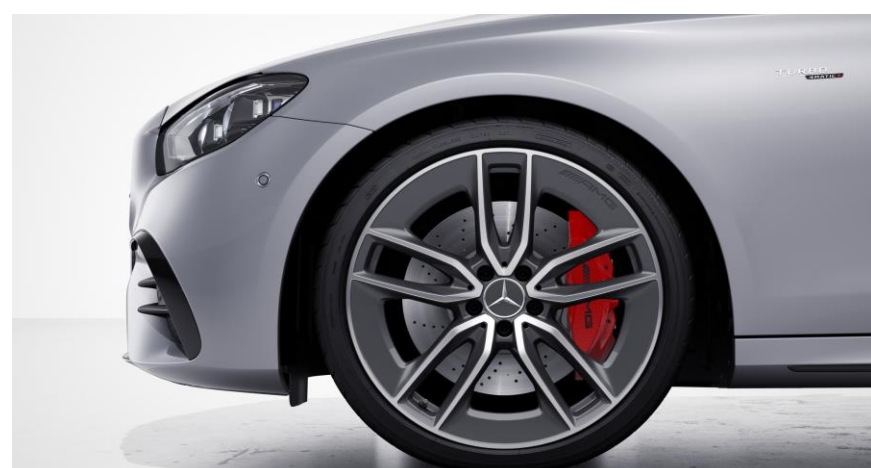
Llantas de aleación AMG de 20" y 5 radios color gris tántalo y pulidas a alto brillo, delante: 245/35 R20 ,detrás: 275/30 R20