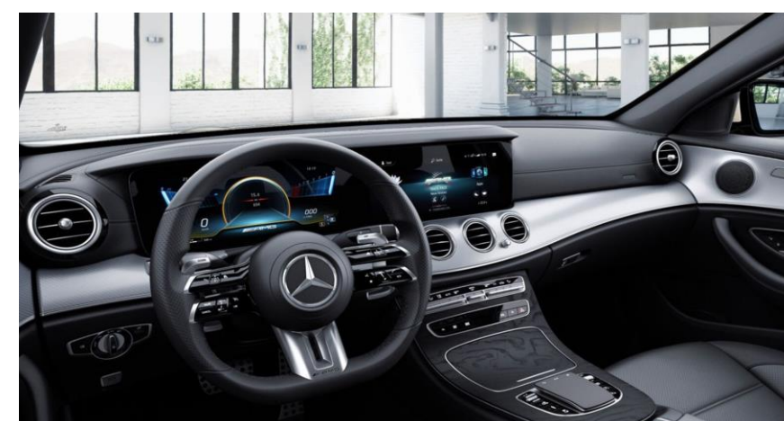
Dos pantallas digitales para cuadro de instrumentos y sistema de infoentretenimiento MBUX